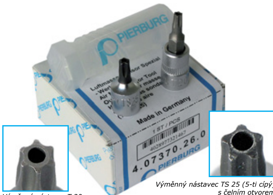
Výměnný nástavec T 20 (6-cípy, Torx®) s čelním otvorem

Oba tyto nástavce v prověřené Motor Service kvalitě jsou kompatibilní s běžně prodávanými 1/4-palcovými nastavcovými systémy.