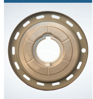
Timing-belt drive pulley without drill hole for non-optimized timing drive

For these vehicles, the catalogs thus feature 2 different kits marked for special applications: