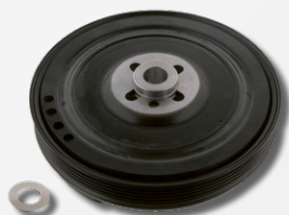
Zestaw naprawczy z tarczą diamentową