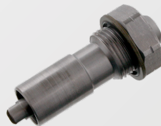
Zdj. 2: Nowy

Więcej technicznych informacji znajdziesz na stronie: partsfinder.bilsteingroup.com