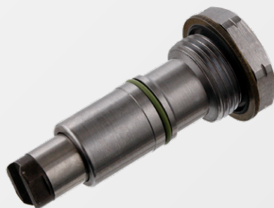
Zdj. 1: Stary

Napinacz łańcucha powinien osiągnąć pozycję roboczą dopiero po nałożeniu łańcucha. Uniemożliwi to przeskakiwanie łańcucha rozrządu podczas pracy silnika. Szczegółowe informacje prosimy zaczerpnąć z załączonego Info.