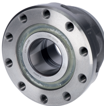
Imagem 2: o n.º de art.º 805532.03.H195 não possui qualquer vedação. Essa função é assumida pela capa do cubo.

Ter em atenção os dados do fabricante de veículos!