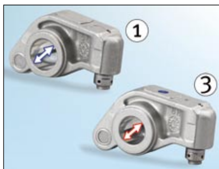
Foto. 2: Średnica otworu w dźwigience zaworu ssącego jest większa (1)

Podczas montażu należy zwrócić szczególną uwagę na właściwy dobór dźwigienek. Różnica jest widoczna w średnicy otworu (foto. 2) oraz w skosie dźwigienek (foto. 3).