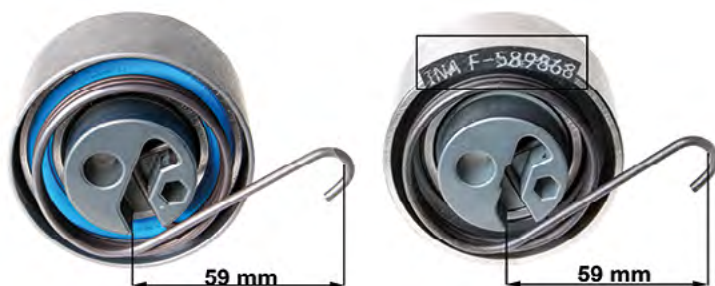
Foto 2: 531 0819 10 – stary wygląd (po lewej), nowy wygląd (po prawej)

Znakami rozpoznawczymi są numery naniesione na rolce oraz różne kolory sprężyn (Foto 1, 2).