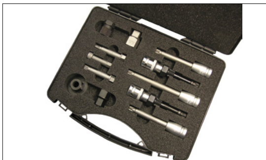
Foto3: Narzędzie specjalne INA - 400 0241 10

Należy stosować się do zaleceń producenta pojazdu!