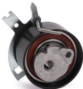
Foto 1: Rolka napinająca INA 531 0810 10

W okresie przejściowym, mogą być dostępne oba typy napinaczy.