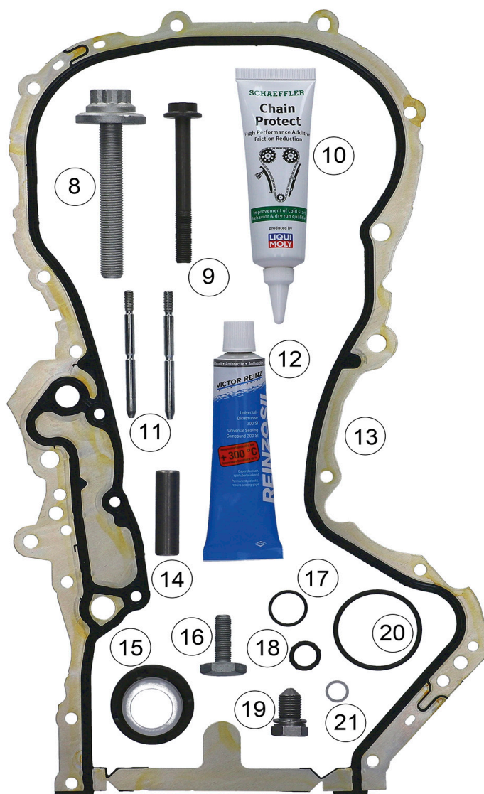
Foto 2: 559 0154 30/559 0154 31 – elementy składowe zestawu INA KIT

Podczas instalacji obudowy rozrządu i miski olejowej należy użyć pinów ustalających znajdujących się w zestawie INA KIT. Dokręcić do głowicy i bloku silnika zgodnie z procedurą montażu producenta.