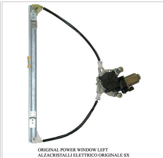
ORIGINAL POWER WINDOW LEFT ALZACRISTALLI ELETRICO ORIGINALE SX