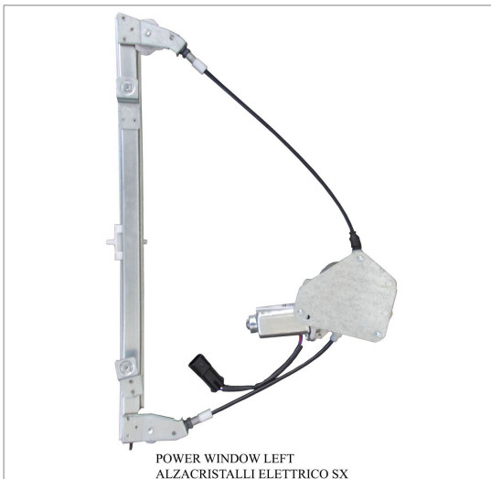
POWER WINDOW LEFT ALZACRISTALLI ELETRICO SX

THIS INSTALLATION INSTRUCTION IS FOR BOTH LEFT AND RIGHT SIDE. CETTE INSTRUCTION DE MONTAGE EST POUR LES DEUX COTES DROIT ET GAUCHE. DIESE MONTAGE-ANLEITUNG IST FÜR DIE BEIDE LINKE UND RECHTE SEITE. ESTA INSTRUCCION DE MONTAJE ES PARA LOS DOS LADOS IZQUIERDO Y DERECHO. AS PRESENTES INSTRUÇÕES VALEM TANTO PARA O LADO ESQUERDO QUANTO PARA O DIREITO. DEZE AANWIJZINGEN GELDEN VOOR ZOWEL DE LINKER- ALS DE RECHTERKANT. Η ΠΑΡΟΥΣΑ ΟΔΗΓΙΑ ΑΦΟΡΑ ΤΟΣΟ ΤΗΝ ΑΡΙΣΤΕΡΗ ΟΣΟ ΚΑΙ ΤΗ ΔΕΞΙΑ ΠΛΕΥΡΑ. LA PRESENTE ISTRUZIONE VALE SIA PER IL LATO SINISTRO CHE PER IL LATO DESTRO.